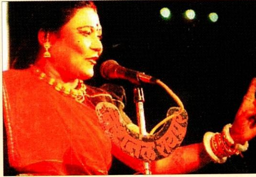
तीजन बाई (पंडवानी गायिका)