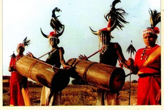
आदिवासी नृत्य (बस्तर)